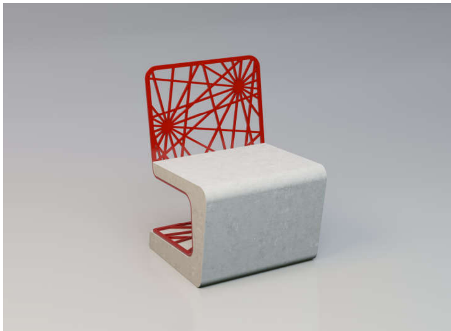
DISEÑO: GIBILLERO DESIGN